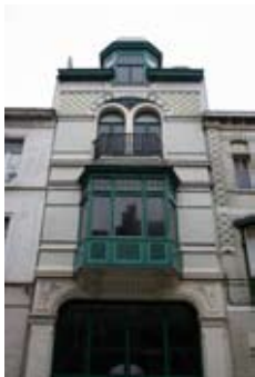
Villa La Tourelle