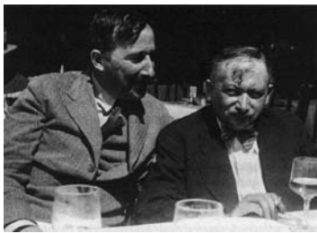
Stefan Zweig en Joseph Roth op een terras in Oostenrijk, 1936