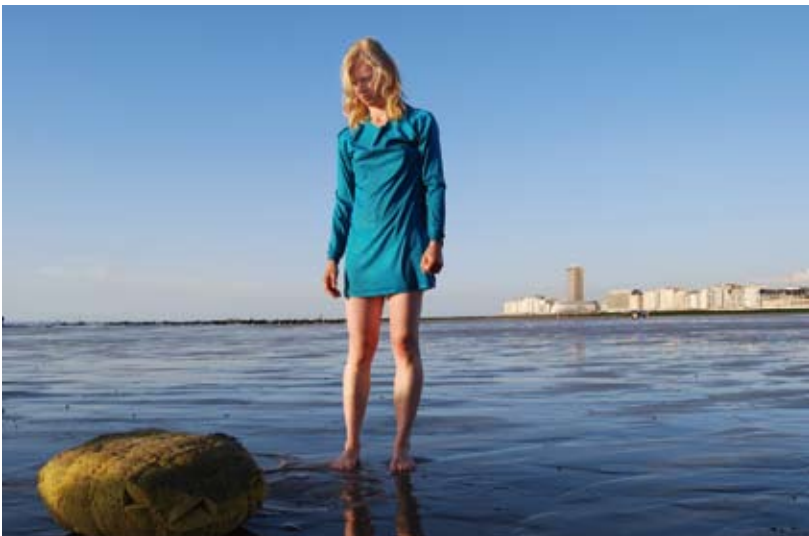
Dansand!, editie 1, 2008 / Charlotte Vanden Eynde