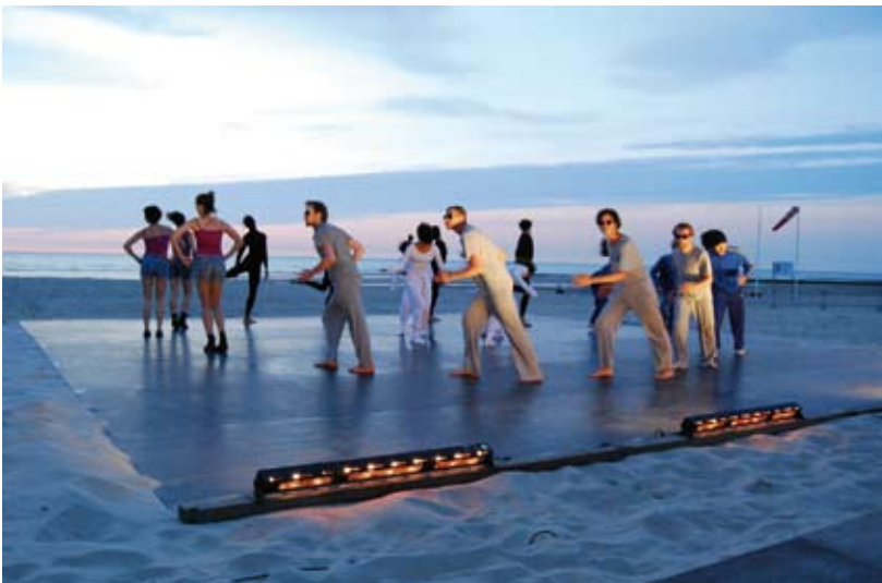
Dansand!, editie 1, 2008 / P.A.R.T.S.