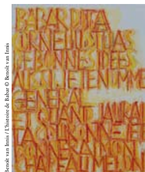
Benoît van Innis / L'Histoire de Babar © Benoît van Innis

ZATERDAG & ZONDAG VAN 15u TOT 18u (VRIJE TOEGANG) EN OP AFSpraak