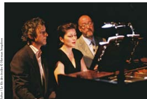
Babar / Le fils des étoiles © Herman Sorgeloos