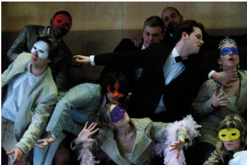
La Mort au Bal Masqué, 16 februari 2010