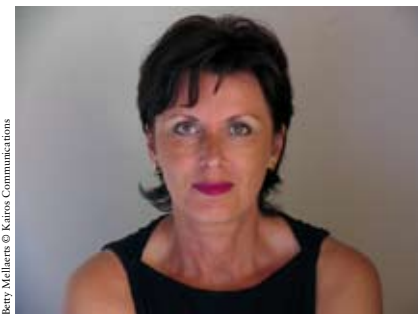
Betty Mellaerts