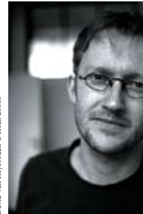
David Van Reybrouck